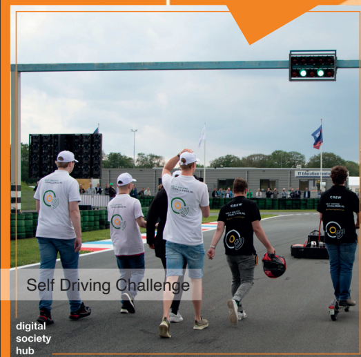
Self Driving Challenge