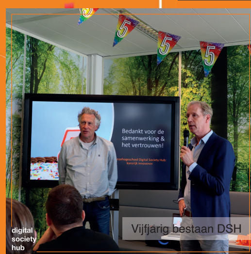
Vijfjarig bestaan DSH